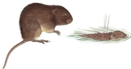
Dessin d'un Campagnol amphibie © G. Delenclos

L'espèce vit en groupes familiaux, pouvant atteindre une densité de 5 individus pour 100 mètres de berges (Noblet, non daté).