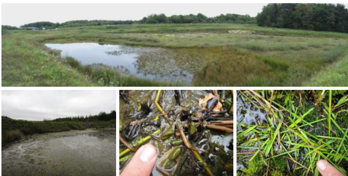
Habitats et indices de présence du Campagnol amphibie, photographies prises hors site