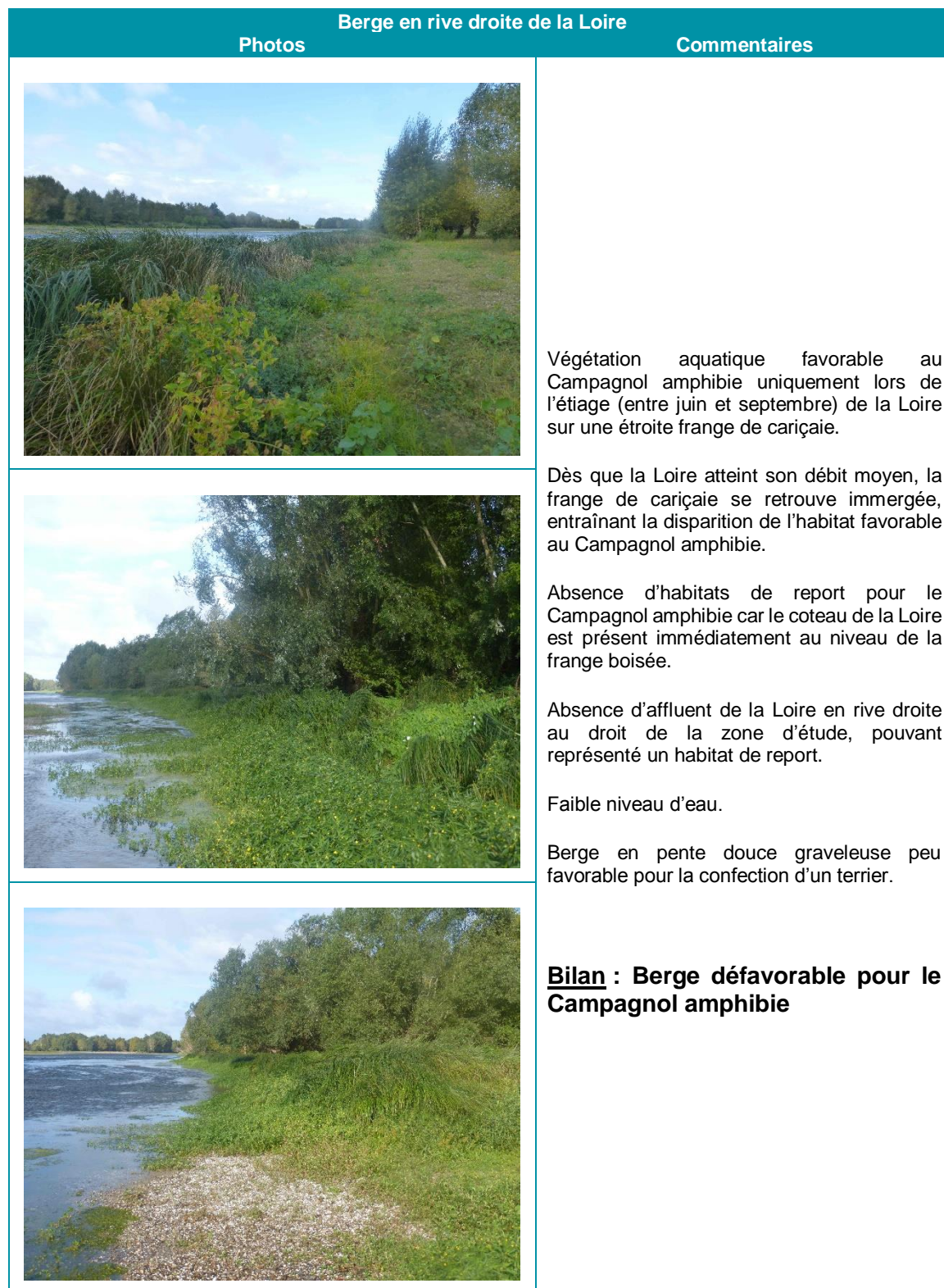
Tableau 3 : Reportages photo des caractéristiques de la berge en rive droite de la Loire